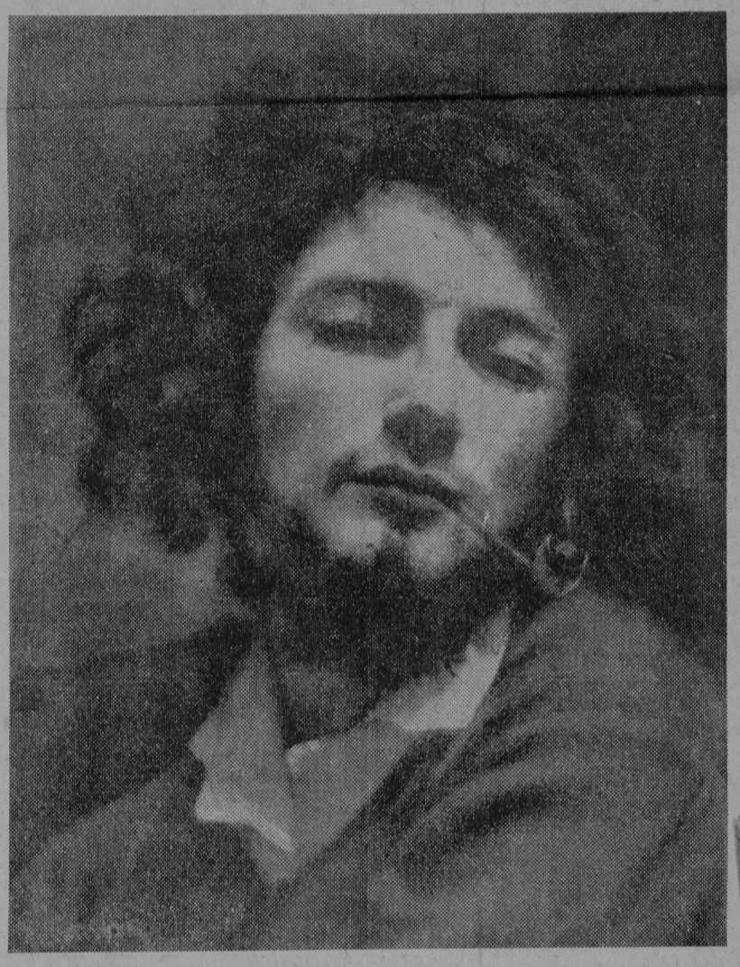
« L'HOMME A LA PIPE »

Le caricaturiste Cham, dans le « Charivari », publiait un dessin avec cette légende : « Femme de 45 ans sur le point de se laver pour la première fois de sa vie, dans l'espoir d'apporter un soulagement à ses varices. » Le catalogue cite