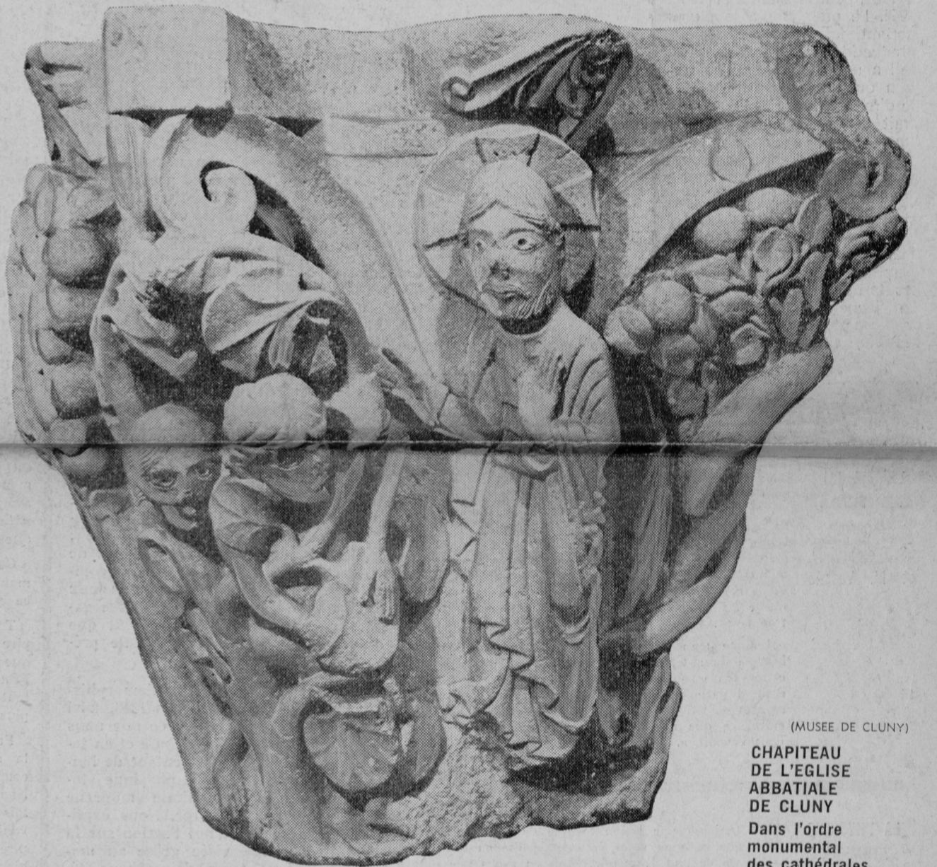
(MUSEE DE CLUNY) CHAPITEAU DE L'EGLISE ABBATIALE DE CLUNY Dans l'ordre monumental des cathédrales.