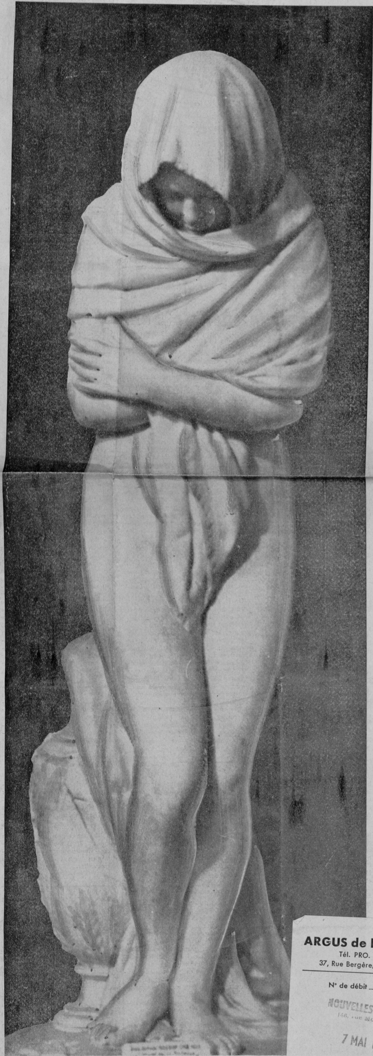
HOUDON : LA FRILEUSE OU L'HIVER. On peut se demander si cet idéal n'est pas dépassé.