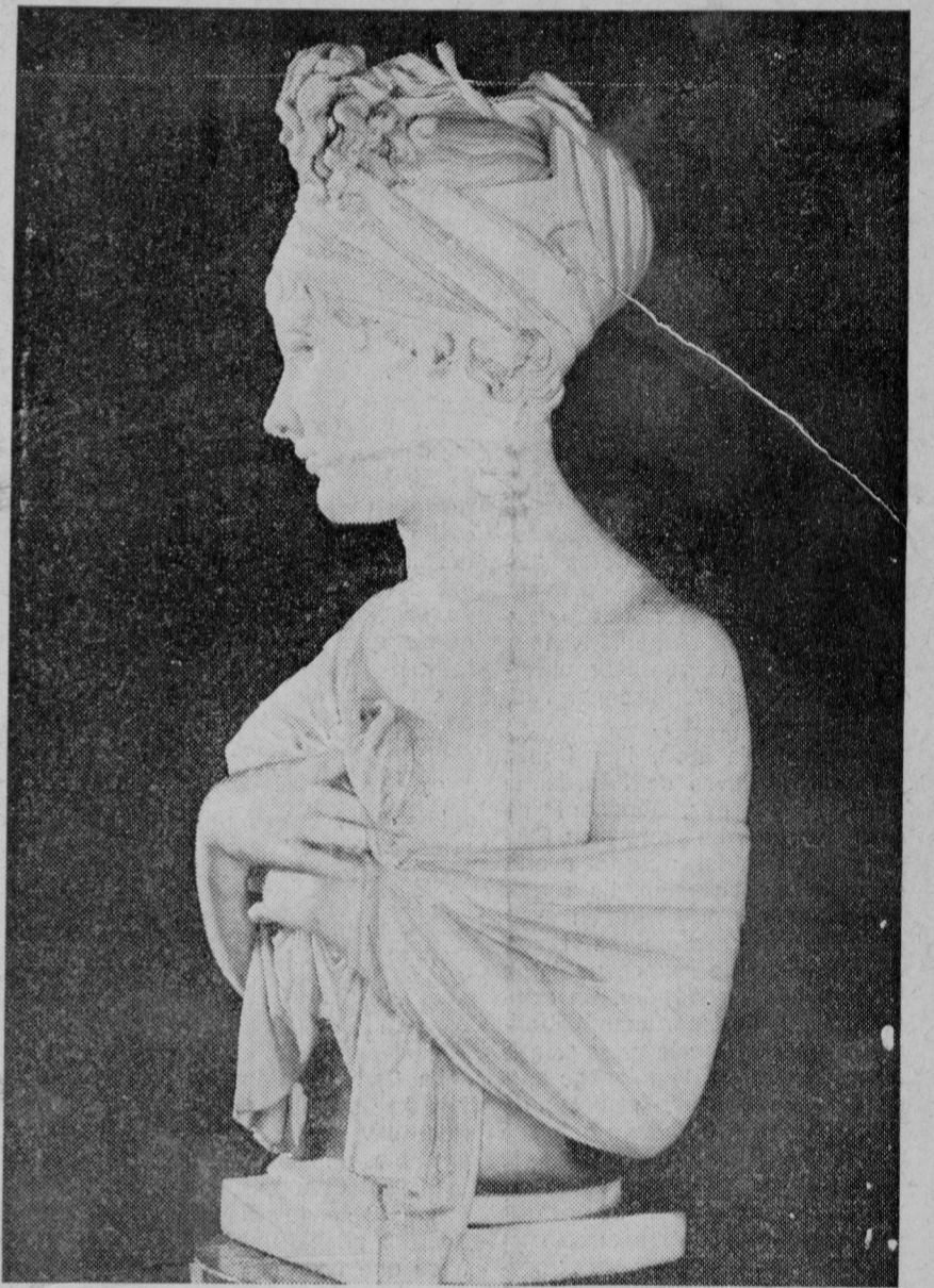
JOSEPH CHINARD : MADAME RECAMIER. Chef-d'œuvre de subtilité psychologique.

Sur ce schéma se greffent les variantes des styles dont il n'a été possible de représenter que les plus accusées : interprétations diverses des thèmes romans par les tempéraments de Bourgogne, de Languedoc, de Poitou et de Provence ; transposition alsacienne ou toulousaine de l'art gothique de l'Île-de-France ; au XV e siècle, lyrisme transcendant de Claus Sluter suivi d'une réaction de douceur ; enfin, dès le XVI e , balancement incessant entre esprit classique et tentation baroque.