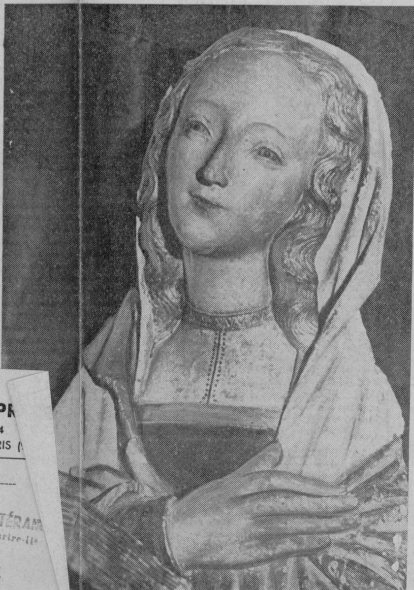
HOUDON : L'ANNONCIATION. Image de dévotion.