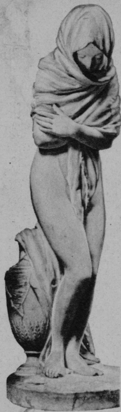
Jean Antoine Houdon : « La Frileuse » (Musée Fabre, Montpellier).

Un frisson, c'est peu de chose, et pourtant que de problèmes soulève ce réflexe ! Il n'est, en fait, qu'une exagération du tremblement, généralement imperceptible, dont la machine humaine est sans cesse animée. C'est dire qu'en soi le frisson est à peu près anodin. Il est tout de même une cause appréciable de fatigue.